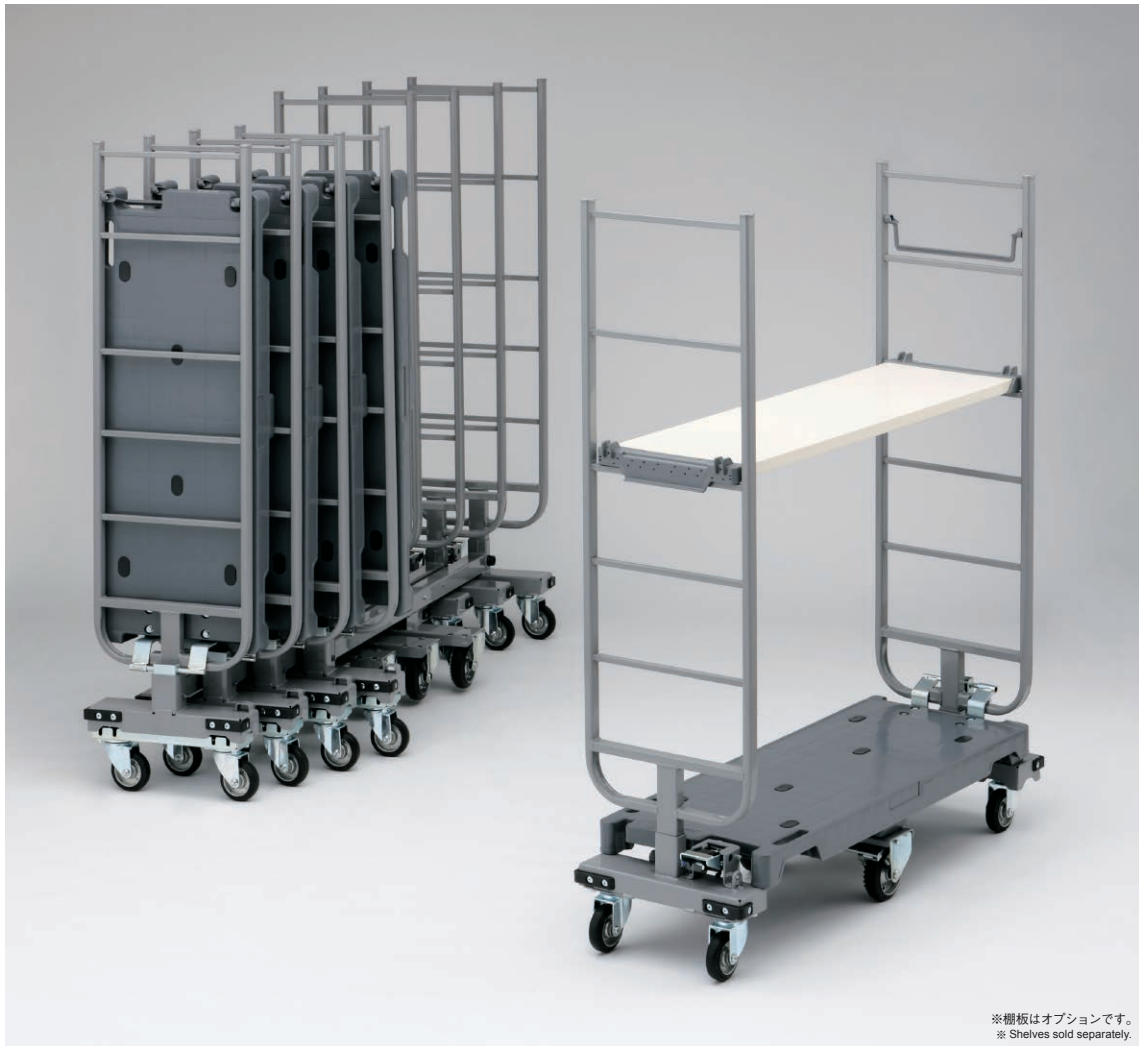
※棚板はオプションです。 ※ Shelves sold separately.