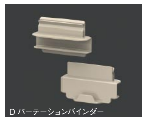
D パーティションバインダー