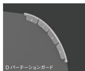
D パーティションガード