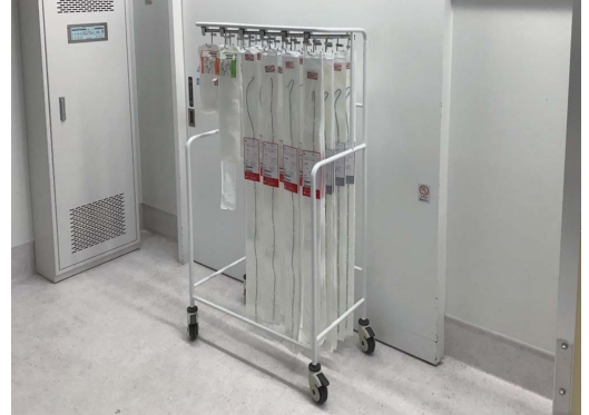
血管造影室におけるカテーテル収納例