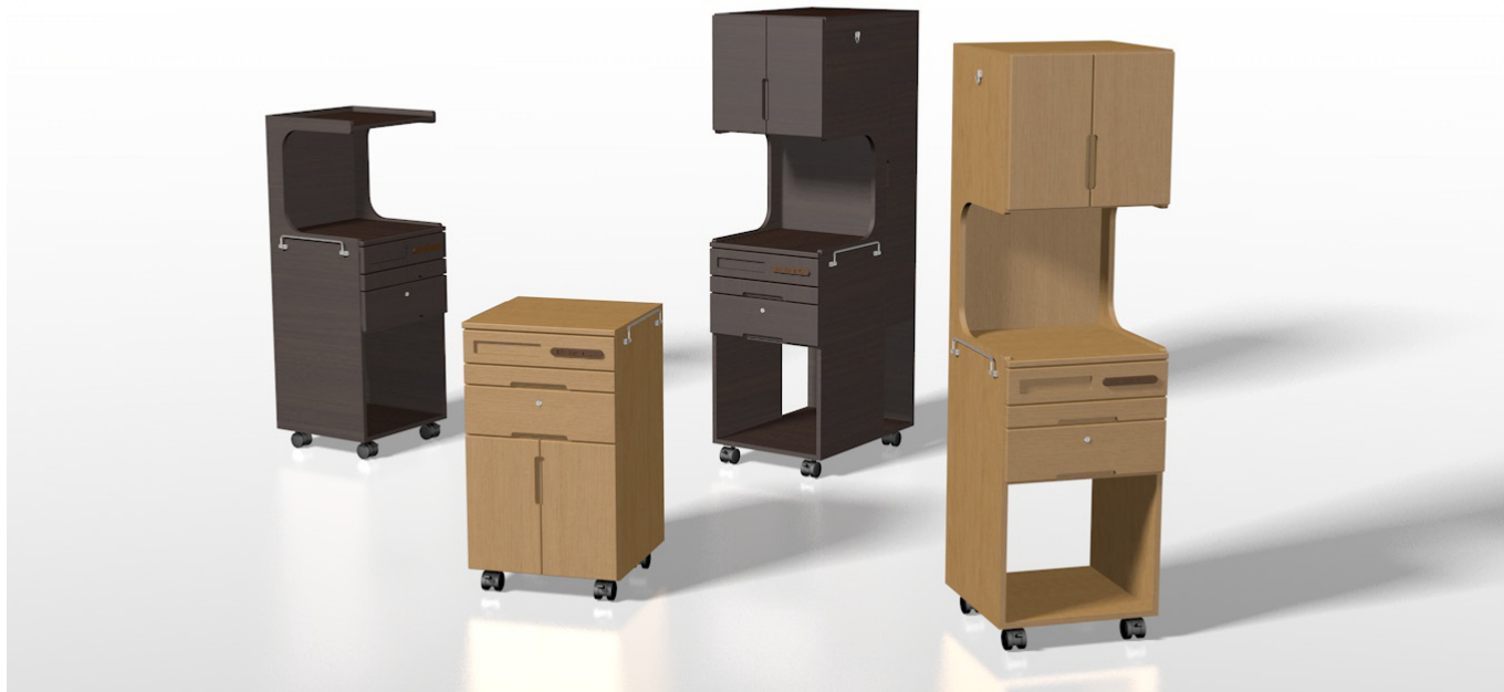
ME床頭台ロータイプ