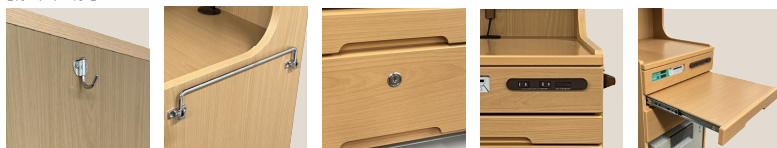
荷物フック (両側面) | 折畳式タオルハンガー (両側面) | シリンダー錠 (引出し1杯) | コンセント (AC:2口,USB:1口) | スライドテーブル

材質：MDF 表面材：ポリ化粧板、プリント化粧紙 キャスター：Φ60 (4輪自在) 前2輪ストッパー付き