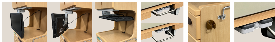
テレビアーム(天吊り式) | 一括ロックキャスター | 杖ホルダー(片側面) | センサー式フットライト