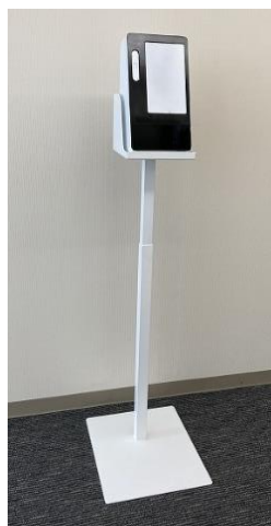
パナソニック対応 (Pタイプ)