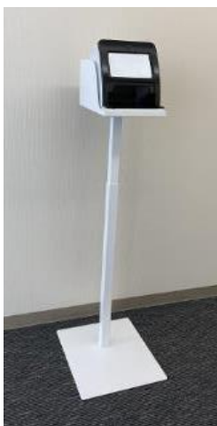
富士通対応 (Fタイプ)