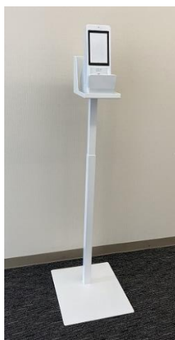
キャノン対応 (Cタイプ)